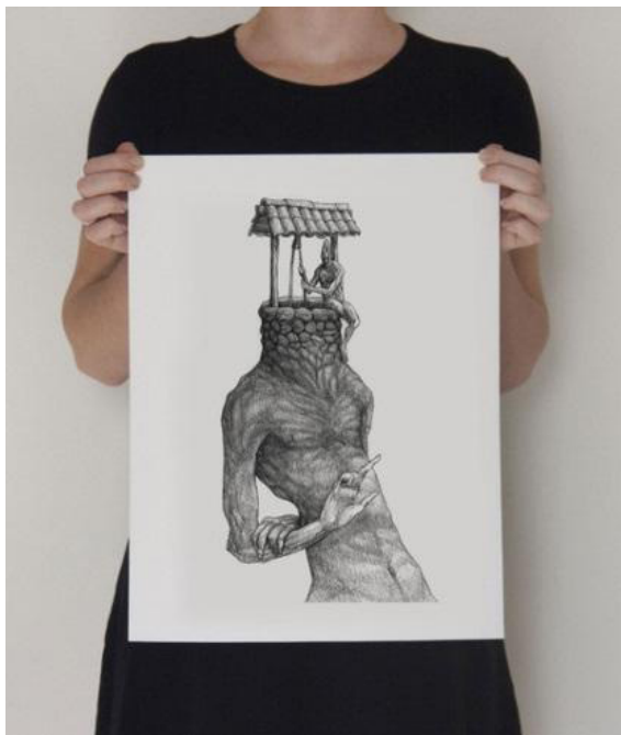
Figura 2. “Homem com profunda sede de si” (Susano Correia).

No ateliê “Eu e eu mesmo” foram apresentadas algumas obras de Susano Correia. O artista possui galerias com diversas imagens que retratam, de forma impactante e incômoda, frases e temas do cotidiano, como ilustra a Figura 2 .