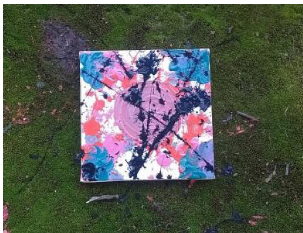
Figura 1. Tela produzida com tinta guache por um aluno do Ensino Médio. Ateliê 1.

violências psicológicas. Em discussão, questiona-se se podemos nos libertar das marcas da violência ou se aprendemos a elaborar elas, de forma a aprender e resignificá-las. Conversamos também sobre outras formas de violência e salientamos marcas não são resultados apenas de violências físicas, encorajando os alunos a socializarem sobre vivências pessoais, caso estivessem dispostos e se sentissem seguros.