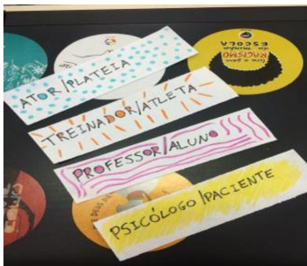
Figura 4. Papéis da instrução das mímicas. Ateliê 3.

Além disso, conversamos sobre os estereótipos que são criados em todas as profissões. Uma das profissões que todos os grupos adivinharam com maior facilidade foi a de modelo, quando o grupo refletiu sobre esse fato algumas hipóteses foram levantadas, pois todos representaram mulheres extremamente magras, altas e que tinham o trabalho resumido a desfiles e passarelas. Após essas constatações, conversamos sobre como esse cenário tem mudados nos últimos e como nós também reproduzimos diversos estereótipos, ressaltando a importância de questioná-los. Por fim, os adolescentes compartilharam os estereótipos que as pessoas colocam sobre eles e como lidam com isso. Conversamos, também, sobre como isso pode ser violento psicologicamente, quanto nos limitamos, nos podamos ou nos recriminam em vários aspectos da vida.