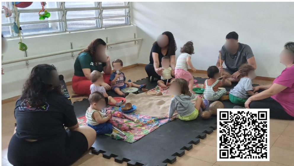
Figura 2 - Bebês e Crianças Bem Pequenas explorando o espaço estético étnico-racial.