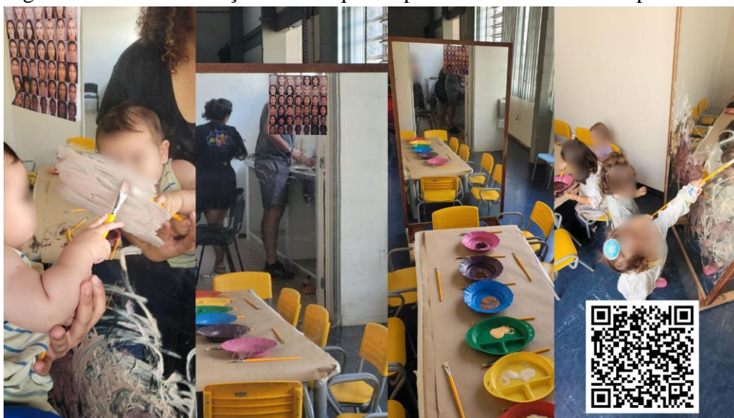
Figura 3 - Bebês e Crianças Bem Pequenas pintando suas cores no espelho.