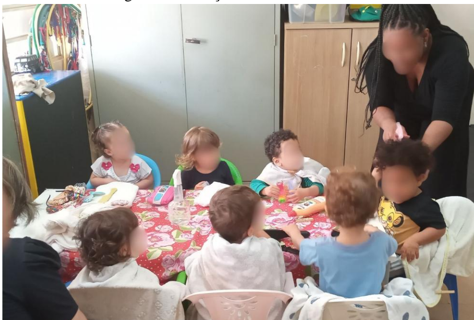
Figura 1 - Crianças finalizando o cabelo.