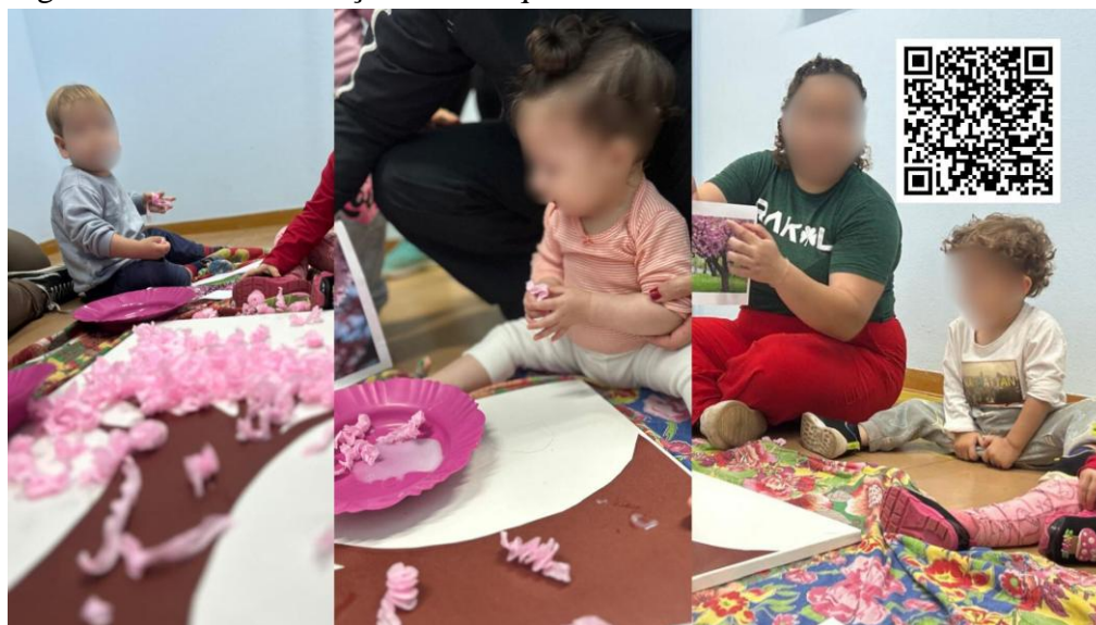
Figura 4 - Bebês e Crianças Bem Pequenas colando as flores de Sakura.