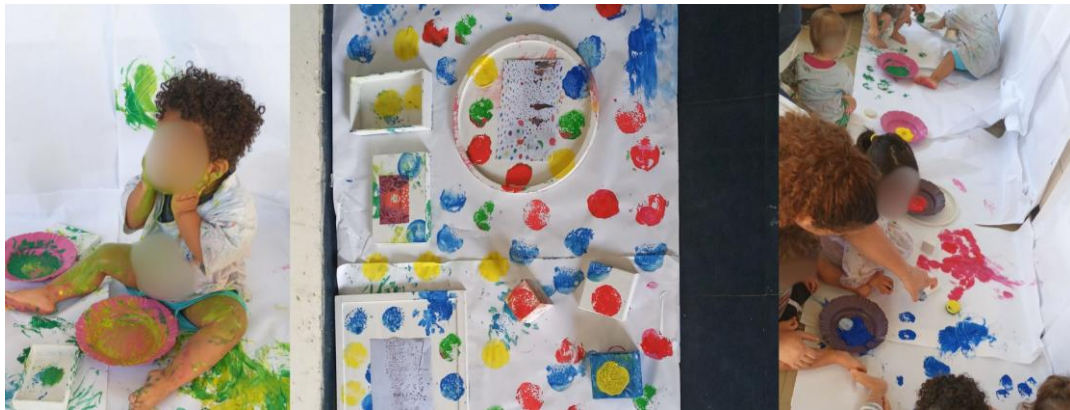
Figura 5 - Releitura da obra Obliteration Room de Yayoi Kusama.